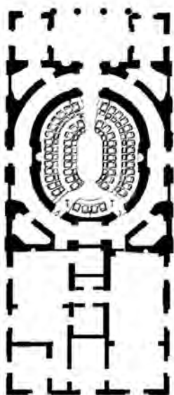
Εικ. 3. Η Ιόνιος Βουλή-Κάτοψη