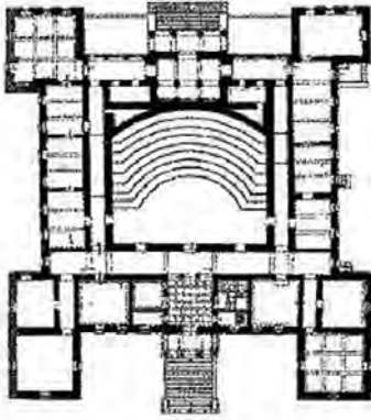
Εικ. 1. Η Παλαιά Βουλή στην Αθήνα – Κάτοψη

© Ίδρυμα της Βουλής των Ελλήνων για τη Δημοκρατία και τον Κοινοβουλευτισμό