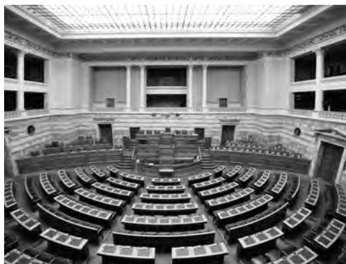
Εικ. 5. Το Ελληνικό Κοινοβούλιο